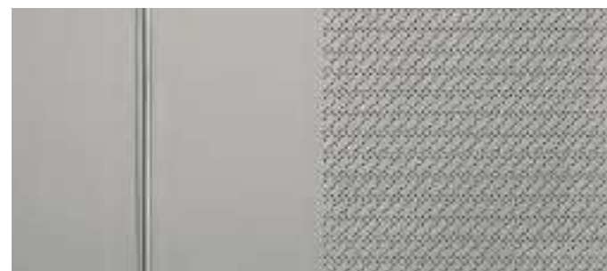
Cuir gris clair