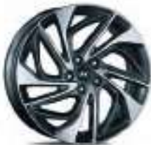
Jantes alliage 19"