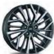
Jantes alliage 18"