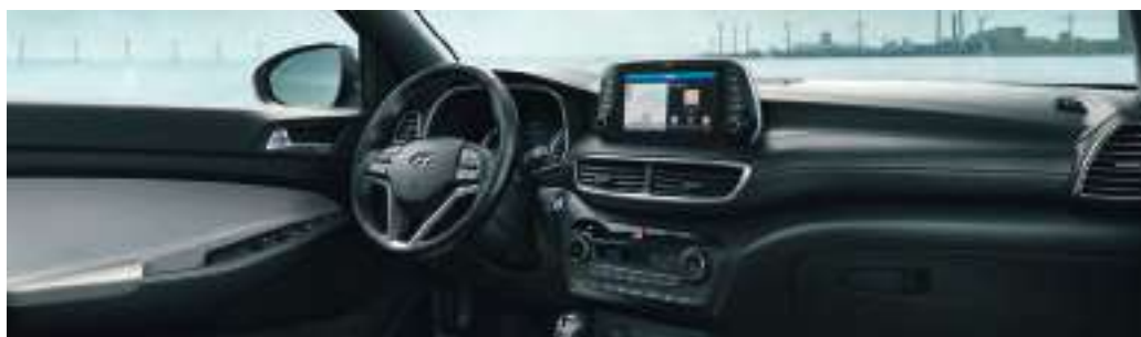
Bi-ton gris clair et noir