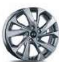
Jantes alliage 17"