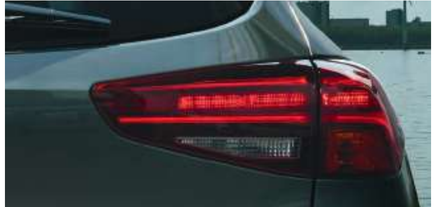
Nouveaux feux arrière à LED. Double sortie d'échappement (indisponible sur 1.6 GDi 132).