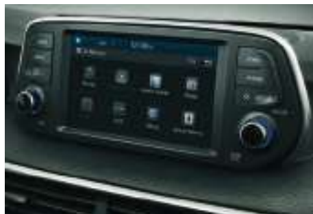
Écran tactile 7" avec Apple CarPlay™* et Android Auto™*.