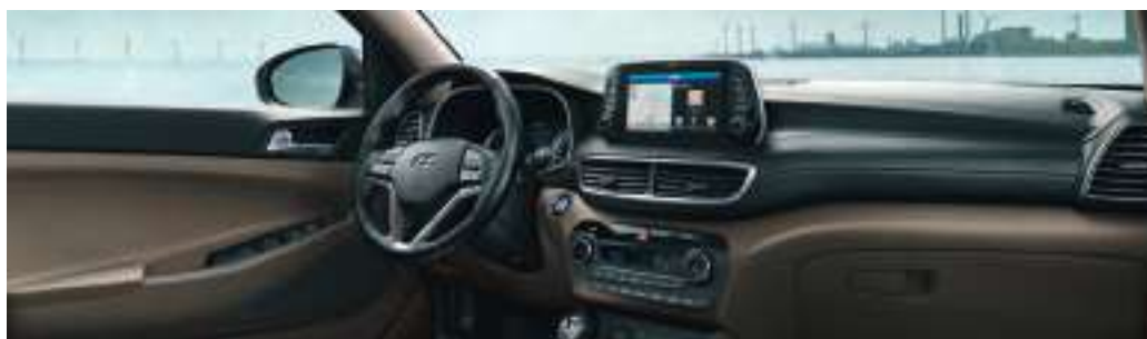
Bi-ton beige et noir