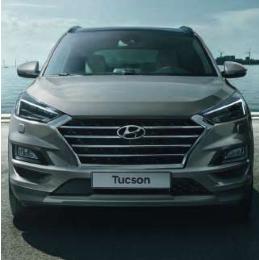
Nouvelle calandre en cascade caractéristique du design Hyundai.

Nouveau Tucson présente de toutes nouvelles faces avant et arrière qui le distinguent.