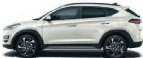
Polar White (non métallisée)