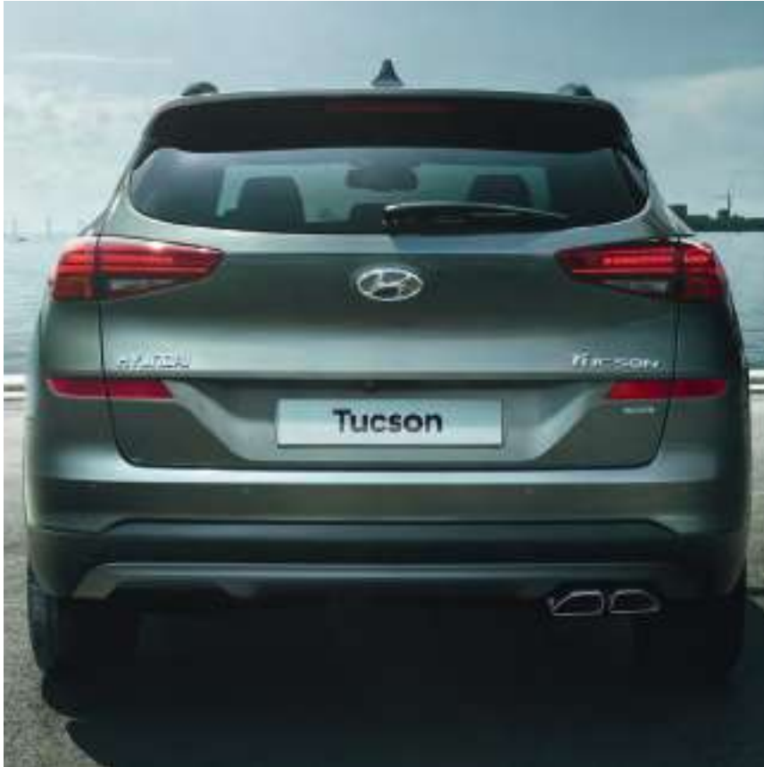
Bouclier arrière redessiné.