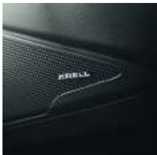
Système audio premium Krell.