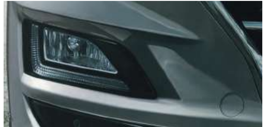
Nouveaux feux avant bi-LED avec feux de route intelligents.